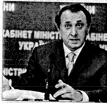
Богдан Данилишин, министр экономики Украины, считает, что масштаб деятельности компании не имеет значения для положительного урегулирования спора в рамках ВТО

Кроме того, проблемные вопросы становятся предметом обсуждения в рамках деятельности соответствующих межправительственных органов двустороннего сотрудничества (межправительственные комиссии,